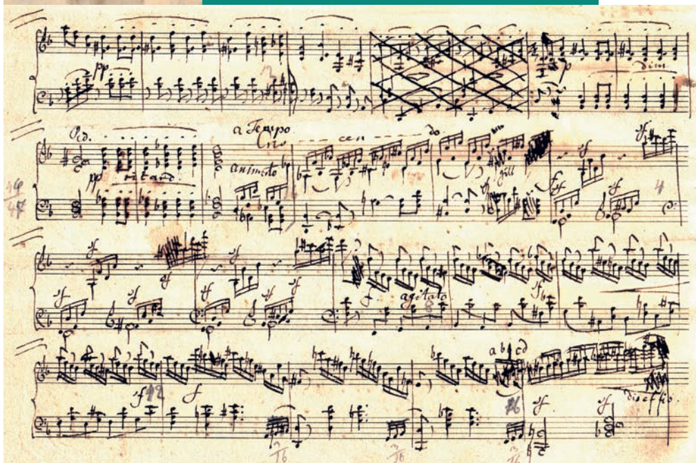
Piano Trio in D minor op. 49, Autograph of the piano part, Movement IV, b. 230–51, Breitkopf & Härtel Archives

Thematic-systematic Catalogue of the Musical Works